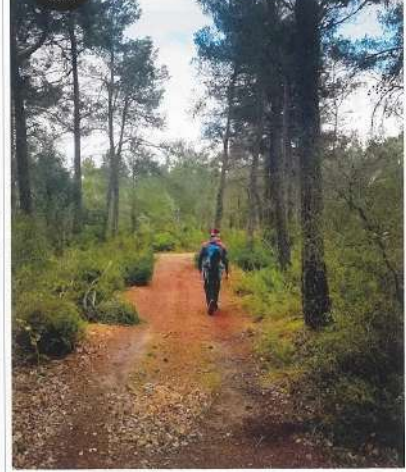
La ruta recorre part de les Garrigues, que separa les comarques de l'Alt Camp i l'Alt Urgell.

molts camins i antics camins de ferriades que serveixen per anar connectant el bosc de valls i per connectar Fulleda amb Senen, a la Conca de Barbera. Molts han anat quedant tapats per la vegetació, però la gestió de Fulleda Turisme Actiu es dedica a desenvolupar les tanques hi rutes i publicitat, com la que hem anat.